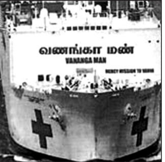
Vananga Man - LTTE Ship වන-ගාමන් - කොටි නැව

The Tamil Tiger terrorists are back at their usual ploys again! Since about a couple of weeks these "angels of mercy" seem to have landed in areas of London where Tamil tiger organisers have been usually haunting for years. This time it is for a "mercy mission to the Vanni" to take food, medical supplies etc. to supposedly suffering people internally displaced by the war. These are planned to be taken by a ship named VANANGA MAN. Is it one of the Tiger ships still remaining afloat?