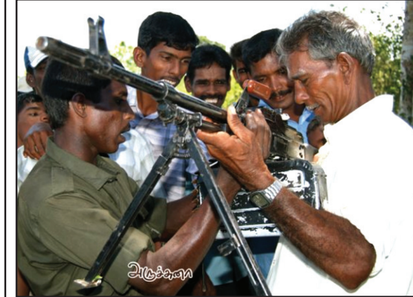
මුලතිව්වල වයස්ගත අහිංසක වැඩියෙක්, අහිංසක කොටි තරණයන්ගෙන්, තුවක්කුවකින් හිවැරදිව හමුදාවට වෙඩිතබන්නේ කෙසේදැයි අහිංසක ලෙස ඉගෙන ගන්නා අයුරුය මේ.

ගිය පාරක් මම මේ කිරුවෙන් කතා කළේ ලෝකයේම ඉන්න අහිංසක මිනිස්සු ජාතියක් වන මුලතිව් වල කොටිනට කොටු වෙලා ඉන්න දෙමළ මිනිස්සු ගැන. මේ සැරෙක් තව ටිකක් ඒ අය ගැනම ගිය සැරේ කියන්න මතක නැති වෙව්ව දේවල් ටිකක් කියන්න හිතූණ. ඒ අය අහිංසක බව අපට පිළිගන්න වෙනවා, මොකද මුළු ලෝකම රටවල් එකතුවෙලා කියන නිසා. මුලතිව් කොන් කියන තැනක් ද කියලා දන්න නැති අයත් කියනවා මුලතිව්වල අහිංසකයෝ ඉන්නවලු, ඒ අය කොහොම හරි බේරගන්නලු, හැබැයි කාගෙත්ද කියල කියන්නෙත් නෑ. බේරගන්නලු. ඒ අතරේ තවම කාටවත් වටහා ගන්න බැරි වෙව්ව දෙයක් කියනවා. ඒ අහිංසකයන්ගේ සම්පූර්ණ ගණන. මුලින් කිව්වා ලක්ෂ දෙක හමාරක් සෙනග එනේ කොටුවෙලා ඉන්න බව. දැනටම හැක්කෑ දාහකට කිට්ටු සංඛ්‍යාවක් එහෙත් පැනලා හමුදා පාලන ප්‍රදේශයට ඇවිල්ලා ඉන්නවා කියලා හමුදාව සැබෑ සංඛ්‍යාලේඛන පමණක් නෙවෙයි, ඒ ආපු අය දැන් ඉන්න ප්‍රදේශයේ රූපවාහිනියෙන් පෙන්වුවා. ඒත් තවම කොටි සංපෘට්ටලා කියනවා ලක්ෂ දෙකක් මුලතිව්වල ඉන්නවලු. ඒක හරි පුදුම කතාවක්. එක්කො දවසට සීය ගණනේ අළුතින් දරුවෝ පුසුන කරනවා, නැත්නම් මුත්ත ගණන්කරන්න කේරේනෙ නැහැ. මට මතකයි දොස්තර ජයලත් ජයවර්ධන දැනට මාස හතරකට පහකට ඉස්සර කිව්වා මුලතිව් කැලෑවේ ගර්භණී කාන්තාවෝ 2000 ක් ඉන්න බව. හොඳයි ඒ දෙදානටම එක් කෙනාට පස්දෙනා ගාණේ නිවුන් දරුවෝ හම්බ වුනත් තව ලක්ෂ දෙකක් සෙනග මුලතිව් කැලෑවේ කියවත් ඉන්න බෑ.