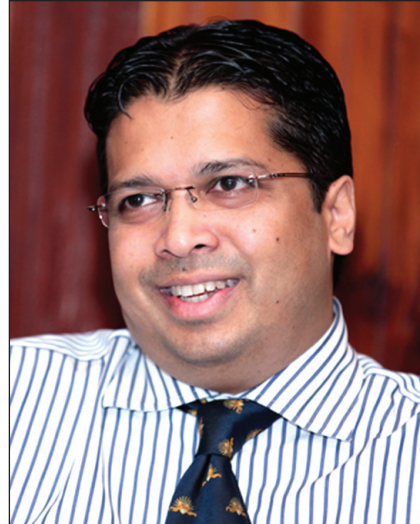
වෛද්‍ය ක්‍රිස්තෝෆර්ස් මහතා Dr Chris Nonis

එක්සත් රාජධානියට නව මහකොමසාරිස්වරයෙක් ශ්‍රී ලංකා රජය විසින් පත් කරනු ලැබ සිටියි. ඒ දොස්තර ක්‍රිස්තෝෆර්ස් මහතා ය. ඒ මහතා මෙම සැප්තැම්බර් 1 වෙනිදා ලන්ඩන් කාර්යාලයේ සිය ධුරයේ වැඩ ආරම්භ කළේ ය. ලන්ඩනයේ සුප්‍රකට රෝයල් ප්‍රී වෛද්‍ය පීඨයෙන්, ඉම්පීරියල් විදුහලෙන් හා ඇමරිකාවේ භාවඩා වෛද්‍ය විද්‍යාලයෙන් වෛද්‍ය උපාධිලත් නොතිස් මහතා වෛද්‍යවරයෙකු වශයෙන් ශ්‍රී ලංකාවේද එක්සත් රාජධානියේද සේවය කර තිබේ. තවද නොතිස් මහතා රාජකීය පොදුරාජ්‍ය මණ්ඩලීය සමාජයේ (Royal Commonwealth Society) නියෝජ්‍ය සභාපතිවරයා ලෙස ද 2008 වසරේ දී පත්කරනු ලැබූ අතර ඒ ධුරය ලත් ප්‍රථම ලාංකිකයා ද ඔහු වන්නේ ය. මහකොමසාරිස් ධුරය පිරිනමනු ලැබීමට ප්‍රථම වෛද්‍ය නොතිස් මහතා කොළඹ සුප්‍රකට මැකවුඩ් සමාගමේ සභාපතිවරයා ලෙස කටයුතු කළේ ය.