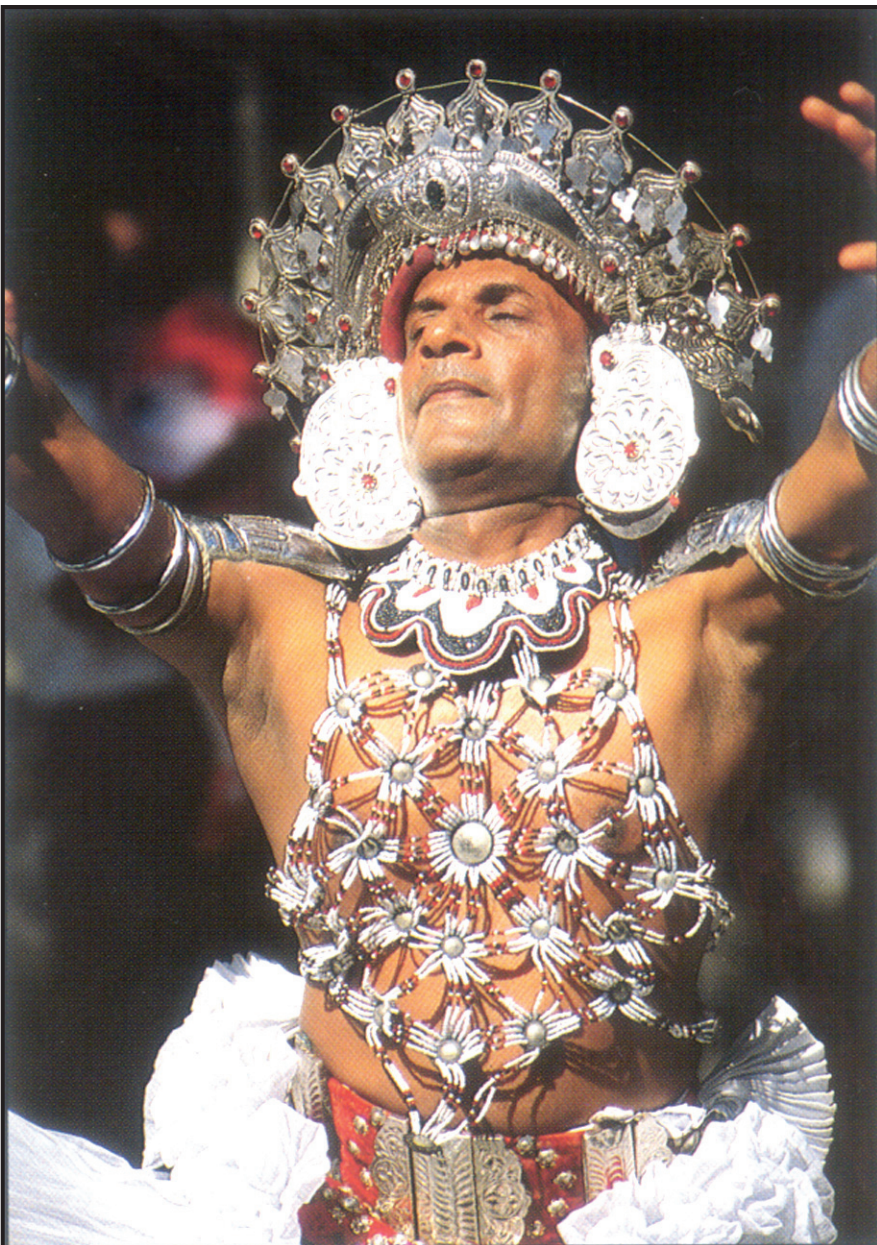
Kandyan Dancer - Sri Lanka

නැගණිතිරි වෙරළ දක්වා විහිදෙන මෙහි එම වෙරළබඩෙහි මුලතිව් නගරය පිහිටා ඇත. පුනරින් වැනි කොටිගේ මුහුදු තොටුපළවල් මෙහි පිහිටා ඇත. වවුනියාවේ සිට උතුරට යන A9 මහා මාර්ගය මුලතිව් හරහා ඒ මැදිහත් දිවෙයි. එම දිස්ත්‍රික්කය ඉවරවෙන මායිමේ සිට උතුරේ පරන්තන් හා අලිමංකඩ දක්වා වූ ප්‍රදේශය කිලිනොච්චි දිස්ත්‍රික්කයයි. A 9 මාර්ගයේ පරන්තන් පැත්තට ළංව එම දිස්ත්‍රික්කයේ ප්‍රධාන නගරය වන කිලිනොච්චිය පිහිටා ඇත. කොටිගේ පාලන මධ්‍යස්ථානය මෙය වෙයි. ප්‍රභාකරන්ලා සැඟවී සිටින බලකොටු මෙයින් නැගණි තිරිට මහ ඝනවනාන්තරයේ පිහිටා ඇත. මන්නාරමේ සිට යාපනය අර්ධද්වීපයට ළංවූ පුනරින් දක්වා වූ අනෙක් ප්‍රධාන මාර්ගය වන A32 ඝන කැලෑව මැදිහත් ඊසාන පැත්තට දිවෙයි. A 32 සහ A 9 අතර තිබෙන විශාල ප්‍රදේශය ඝන කැලෑවෙන් වැසී ඇත. කොටින්ට එදිරිව තද සටන් සිදු වනු ඇත්තේ මෙහි ය. මා මේ දැක් වූයේ ප්‍රදේශ පසුබිමයි. අප හමුදා කිලිනොච්චි දිස්ත්‍රික්කයට ඇතුළු වුවද කිලිනොච්චි නගරයට එනම් කොටි මධ්‍යස්ථානයට තව බොහෝ දුරක් ඇත. මේ දෙක පටලවා ගත යුතු නොවේ. සමහර මාධ්‍යවලින් පවා මේ වැරදි හැඟීම ඇතිකර තිබේ. පසුගිය සටන් වලදී අප හමුදා සටන් කළ ආකාරයෙන් මෙවැනි ඝන වනාන්තර කුළ සටන් වලට ඔවුන් දැන් ඉතා හුරු පුරුදු බව ද, බොහෝ තැන්වලදී කොටින් මුලාකොට වටලා විනාශකිරීමට ද යුද්ධ උපාය මාර්ග උපයෝගී කරගැනීමේහි එම සේනාධිපතින් දක්ෂවී ඇත. මේ පිළිබඳව ඒ සටන් ගැන කළ විමසුම් වලදී යුද්ධ ගැන දන්නා