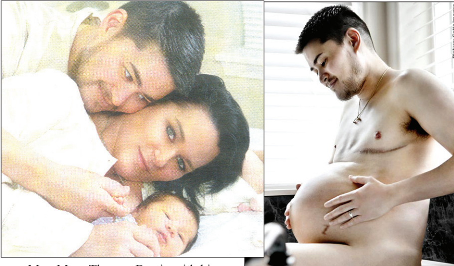
ඇත්තට මේ මව ද ? නැත්නම් පියා ද ?