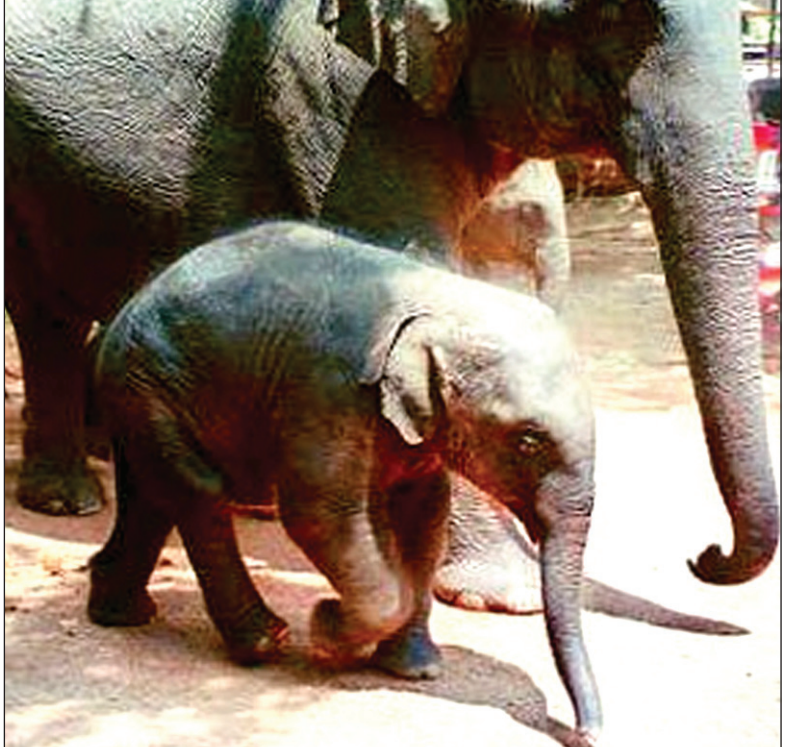
One of the cubs with its mother before being taken away