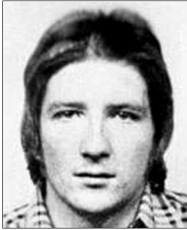
උපවාසයේ යෙදී මියගිය අයිරිෂ් ජාතික බොබ් සැන්ඩ්ස්