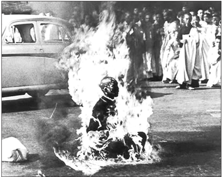
1963 වසරේ දී ක්වාන් ඩාක් නම් විශ්විතාම බොද්ධ හිමියන් සයිගොන් නගරයේ දී තම සිරුරට ගිනිතබාගත් අවස්ථාව