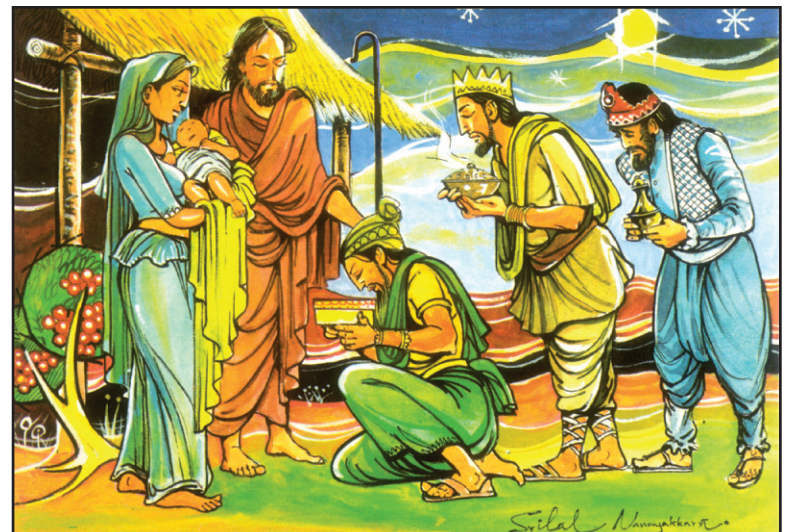
ජේසු උපත - චිත්‍රය - ශ්‍රී ලාභ් නානායක්කාර Sri Lanka