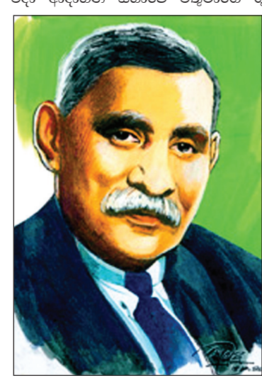
ඩී. ඇස්. සේනානායක මැතිතුමා

1952 මාර්තු 22 දින ලංකාවේ ප්‍රථම අග්‍රාමාත්‍ය ඩී. ඇස්. සේනා- නායක මැතිතුමා අභාවප්‍රාප්ත වන විට මා අවුරුදු අටක පමණ දරුවෙකි. මගේ පියා සමග මමද එම ආදාහන උත්සවය පැවති නිදහස් වතුරඉයට ගිය මට යන්නම් එම සිදුවීම අදත් මගේ මතකයට නැගේ.