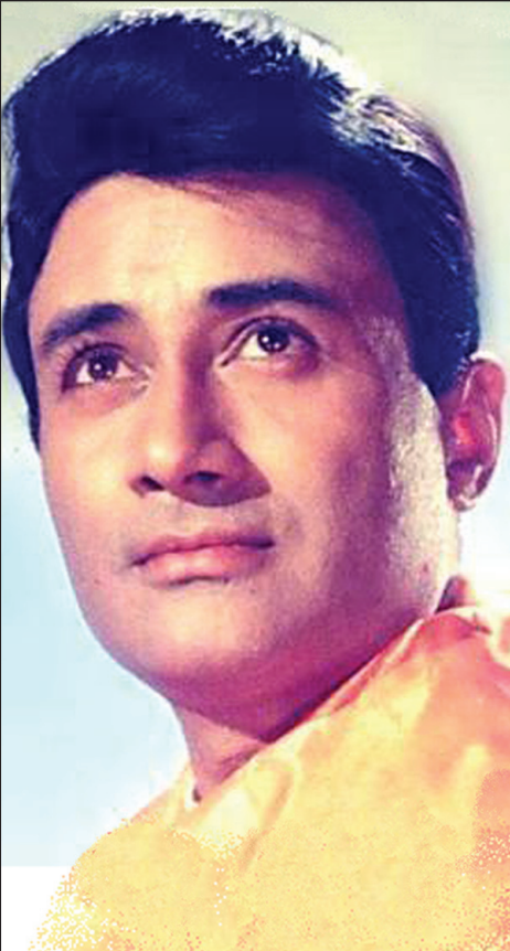
දහසක් යොවනියන් මත්කළ ඒ මුහුණ

දේවි නළුවෙකු හා පැසුණු සිනමාකරුවෙකු ලෙස ජාත්‍යන්තර තලයට ඔසවා තබන්නට සමත් වූ චිත්‍රපටය නම් 1965 දී ඔහුගේ බාල සොයුරා විජය අධ්‍යක්ෂණය කළ ආර් කේ නාරායනගේ ජනප්‍රිය නවකතාවක් පසුබිම්කර ගත් ගයිඩ් චිත්‍රපටයයි. එහි දේවි ප්‍රධාන චරිතය වහිඩා රෙනෙමාන් සමග රහපෑවේ ය. එය යුරෝපයේ බොහෝ රටවල ප්‍රදර්ශණය වූ අතර ඊට සම්මාන ද රැසක් හිමිවූයේ ය.