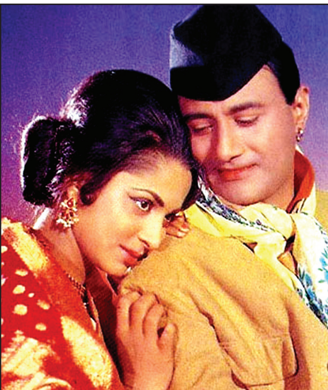
දේවි ගයිඩ් චිත්‍රපටයේ වහිඩා රොහමාන් සමග

ඉන්දියාව තුළ ගුරුදස්පුර් නම් පන්තාබයට අයත් ප්‍රදේශයේය. ඔහුගේ පියා පිෂෝරිමල් ආනන්ද නම් ප්‍රවීන නීතිඥවරයෙකි. දේවි ලාහෝර්හි උසස් පාසැලකට යවන ලදී. (අද ඒ පළාත් සියල්ල අයිති පකිස්ථානයටය.) ඉන් උපාධිධරයෙකු ලෙස සුදුසුකම් ලබූ දේවි කලක පටන් ආසාවෙන් සිටි දෙයක් එනම් ඉන්දීය නාවුක හමුදාවට බැඳෙන්නට තීරණය කළේය. එතෙක් ඔහු ඉන් අසමත් වූණි. ඒ නිසා දේවි සිය වැඩිමහල් සොහොයුරා වන වේතන් අනුගමනය කරමින් බොම්බායේ සිනමා කර්මාන්තය දෙසට