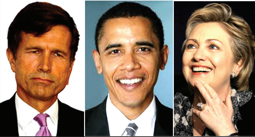
Robert Blake Barack Obama Hillary Clinton

දැනගන්නට ලැබී ඇති පරිදි පෙබරවාරි 27-මාර්තු 23 දක්වා පිනිවනි පැවැත්වෙන එක්සත් ජාතීන්ගේ මානව හිමිකම් කවුන්සලයේ 19 වන සැසිවාරයේ දී ඇමරිකාව ශ්‍රී ලංකාවට එරෙහිව යෝජනාවක් සම්මත කරවීමට බලාපොරොත්තුව සිටී. එයටත් පෙර දැන්ම ම හිරිසිහින් මුලිකත්වය ගෙන ප්‍රධාන නිලධාරීන් තිදෙනෙකු එවා ඇත. ඒ තිදෙන නම් මාර් ඔටේරෝ, රොබර්ට් බ්ලේක් (මොහු මීට කලින්ද ලංකාවේ හොල්මන් කළා ඔබට මතක ඇත.) සහ ස්ටීවන් රූස් යන අය වෙති.