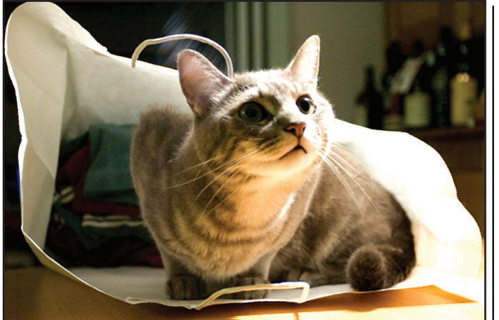
How the cat came out of the bag

මැකෝලේගේ අදහස් හා උපදෙස් පිළිගත් බ්‍රිතාන්‍ය රජය ඒ අනුව ක්‍රියාත්මක වූහ. ඉතා ඉක්මනින් ඉංග්‍රීසිය ඉන්දියාවේ නිල භාෂාව මෙන්ම එරටේ