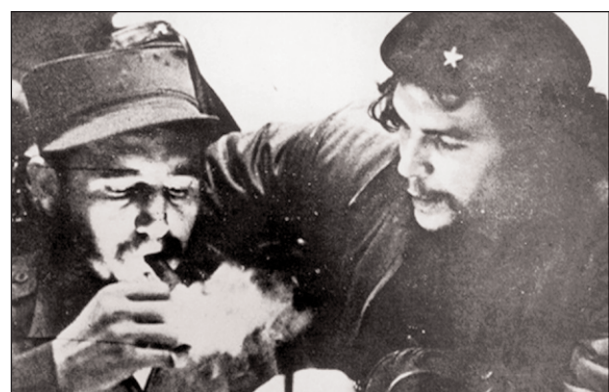
Fidel Castro with Ernesto Che Guevara in the Sierra Maestra Mountains, Cuba during the 1950s. In 1953, Castro launched a failed coup against Batista government. He and his brother Raul were imprisoned, but were amnestied and fled to Mexico. It was here Fidel met Che Guevara with whom he plotted Movimiento 26 de Julio , the successful overthrow of the Cuban government in 1959.