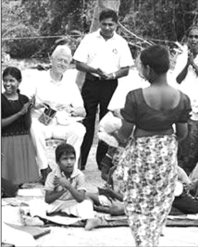
Ex USA President Bill Clinton among the villagers in Hikkaduwa, Srilanka, during the Tsunami tragedies

We found this snippet among numerous news items published during tsunami tragedies. We thought it's worth publishing again. US ex-presidents' visit here did not plant any feeling on me. But what I saw on TV and Daily News lead photograph brought me a feeling. That's inexpressible as usual. Why only Clinton? Yes it's only Clinton, who was playing the miniature drum to which a girl was dancing. The event, that took place in Southern Sri Lanka, was not that important, I feel, but was Clinton's appearance.