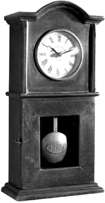
ඉතා පැරණි බට්ටා ඔර්ලෝසුවක්

කුඩා අවධියේ මා දැක්ක දුටු දේවල් අතුරින් මගේ මතකයෙන් ඇත් නොවනා දෙයක් නම් අප නිවසේ තිබුණු බට්ටා ඔර්ලෝසුව ය. අද මෙන් බැටරි වලින් වැඩ කරන ප්ලාස්ටික් ඔර්ලෝසු එකල තිබුණේ නැත. වේලාව බලාගැනීමට පමණක් නොව නිවසක අලංකාරත්වය වැඩිකර ගැනීමට බට්ටා ඔර්ලෝසුව උපකාරී විය. ඉතාම ප්‍රවේශමෙන් කැටයම් නොලා ඇති පෙට්ටියක (බුරුන හෝ කලුර) බට්ටා සහ එහි යන්ත්‍රය ද සවිකර තිබුණේ ය. අංක සඳහන්කර තිබුණේ රෝම ඉලක්කම් වලිනි. මෙකල පදික වේදිකාවල තබාගෙන විකුණන බැටරි ක්‍රියාකාරීත්වයෙන් යුත් ඔර්ලෝසු වාගේ නොව ගෞරවක බිත්තියේ ඉහළ එල්ල බට්ටා ඔර්ලෝසුව මහේශාඛ්‍ය ලීලාවක් පෑවේ ය.