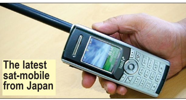
The latest sat-mobile from Japan

අපේ ලංකාව දැන් කාලයක් තිස්සේ මුළු ලෝකම අවධානය යොමු වෙවිලි තැනක් වෙලා. දවස ගානෙම වගේ වෙන්නාවු සිද්ධීන් සංකීර්ණයි. ඒවගේම අවුල් සහගතයි. තව විදියකින් කිව්වොත් බරපතලයි. බටහිර රටවල් කියන විදියට මේ ලන්දේ ඉඳලා ලංකාවේ නාහොට අහන්නේ නැති ඔළු ඉදිමිව් ගතියක් ඇතිවෙලා. වෙනදා බටහිර රටවල නායකයො යමක් කිව්වම ටිකක් බෙල්ල නවලා ඇහුම්කන් දීපු ලංකාව, දැන් බටහිර කියන කිසි දෙයක් තමේකට ගණන් ගන්නේ නැති තත්වකට ඇවිල්ලා. දැන් බටහිරට ඕන ලංකාව අල්ලලා බිත්තියට තියලා ඇණ ගහන්න. එක්සත් ජාතීන්ගේ ලේකම් බැන් වුන්ට කියල තමයි ලංකාව දණගස්වන්න හදන්නේ.