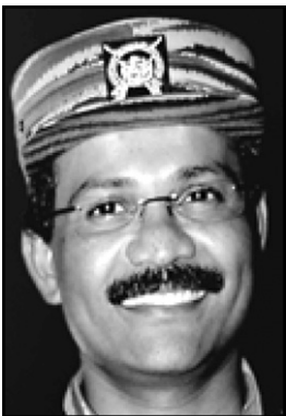
හිතාචෙන කොටි ක්‍රිස්තවාදියා තමිල් වෙල්වම් ගිය සතියේ මරණයට

ලොව පුරා ක්‍රිස්තවාදීන්ට දැන් ලබා ඇත්තේ මහා නරක දසාවක් බව ඉන්දියාවේ සුප්‍රකට දේවභද්‍ර මෝහන්දාස් ගංකර් මහතා ගිය මාසයේ ඉන්දියාවේ හින්දු පත්‍රයට ලියූ ලිපියක කියා තිබුණි. විශේෂයෙන් අල්කයිඩා හා කොටි සංවිධානය ගැන සඳහන් කළ ඔහු, ප්‍රභාකරන් හා බින් ලාඩන් යන ක්‍රිස්තවාදී නායකයන් දෙදෙනාටම මාරක යෙදී ඇති බැවින් ලන්දේම ඔවුන්ගේ අවසානය අසන්නට ලැබෙන බවද කියයි. මේ අතරේ කොටි සංවිධානයෙන් කැඩී ගොස් දැන් කොටි විරෝධීයකු ලෙස ක්‍රියාකරන ඊළම් මක්කල් පක්‍ෂය පිහිටුවාගත් කරුණා පසුගිය සතියේ බොරු පාස්පෝට් එකකින් බ්‍රිතාන්‍යට ඇතුළුවීමේ වරදට ඔහු අල්ලා සිරබාරයට ගත් බව ලන්ඩනයෙන් වාර්තාවෙයි.