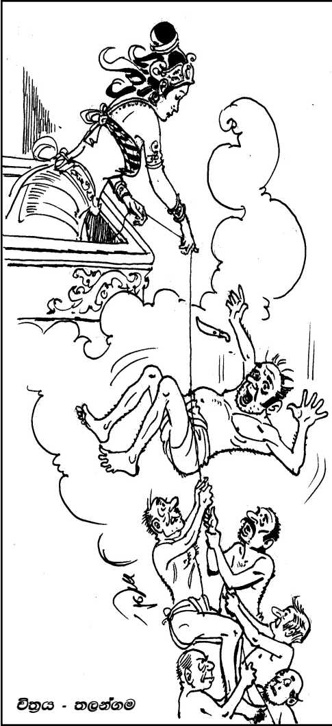
චිත්‍රය - තනේගම

ඒ අනුව දෙවෙන දිග සිල්ක නූලක් හඳලා ඒක දිව්‍ය ලෝකයේ සිට අපාය තුළට වැටෙන්නට සැලැස්සුවා. ඒ නූලේ කොණ ඇය අල්ලාගෙන සිටියා. දුෂ්ටයා