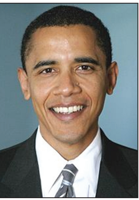
ඇමරිකාවේ නව ජනාධිපති බැරැක් හුස්ටන් ඔබාමා මහතා

ඇමරිකා එක්සත් ජනපදය ඉතිහාසයේ ප්‍රථමවරට අප්‍රිකානු-ඇමරිකානු සම්භවය ඇති ජනාධිපතිවරයෙකු ගිය සතියේ ඡන්දයෙන් පත් කරගත්තාය. ඒ ඩිමොක්‍රැටික් පක්ෂයේ 47 වියැති බැරක් හුස්ටන් ඔබාමාය. ඔහුට ඡන්ද ආසන 349 ක් ලැබුණු අතර, රිපබ්ලිකන් පක්ෂයෙන් තරඟකර පරාජයටපත් ඇමරිකානු සුදුජාතික 72 හැවිරිදි ජෝන් මැකෙන්ට් ඡන්ද ආසන 162 ක් ලැබීණ. ඔබාමා ලැබුයේ ඉතා විශාල ජයක් බව පැහැදිලි ය. ඔබාමා තනිකරම සුද්දෙකු නොවේ. කළු සුදු මිශ්‍රණයකි. ඇතැම් අය ඔහු කල්ලෙකු ලෙසද ඇතැමෙක් ඔහු දෙමුහුන් ලෙසද සඳහන් කරති. එහෙත් එවැන්නෙක් මේතාක් සුද්දන් පමණක් අසුන්ගත් ධවල මන්දිරයේ ජනාධිපති පුටුවේ වාසිවනු ඇතැයි ලොව කිසිවෙකු මේ පසුගිය දා වනතුරු හිතෙන්නන් වත් සිතුවේ නැත. එසේ විය හැකියයි ඡායාමාත්‍රයක සිතුවිල්ලක් ආවා නම් ඒ ආවේ ඔබාමා ජනපති තරඟයට පිවිසෙන්නට නම් දුන්නට