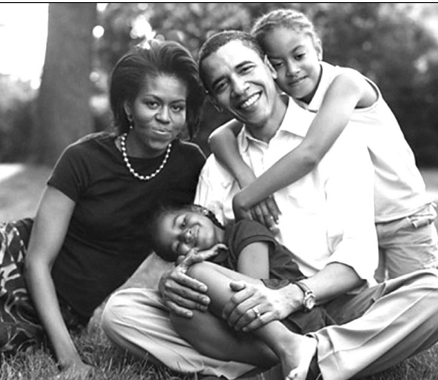
Family Man The new US President Senator Barack Obama with his wife Michelle and two daughters - Malia (ten) and Sasha (seven) in a relaxed pose at his garden just days before the Presidential Election.