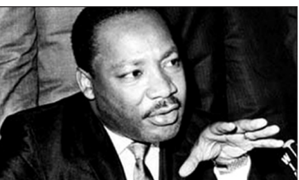
Assassinated Civil Rights leader - Martin Luther King

පසුවය. ඔහු ජනාධිපති වනු ඇතැයි සමහරුන් අනුමාන කළ ද එය කිසිවෙකු ස්ථිර ලෙස සිතූ සිතුවිල්ලක් නම් නොවේ. වහලුන් ලෙස ඇමරිකාවට ගෙන ආ අප්‍රිකානු කල්ලන්ට කිසිදු නිදහසක්, මිනිස් අයිතිවාසිකමක් සුදු ඇමරිකානුවන් දුන්නේ නැත. සිවිල් අයිතිවාසිකම් පනා ලක්ෂ දස ලක්ෂවාරයක් කල මිනිසුන් උද්ඝෝෂණ කරන්නට හා පෙළපාලි යන්නට ඇත. එහෙත් කිසිවක් නොලැබිණ. 1870 මාර්තු 31 වෙනි දින වහලෙකුගේ පුතෙකු වන කෝමස් මුන්ඩ් පීටර්සන් නම් අප්‍රිකානු ජාතිකයා ඊට පෙර කිසිදු කල ජාතිකයෙකු නොකළ දෙයක් කළේය. එනම් ඡන්දය පාවිච්චි කළ ඇමරිකාවේ ප්‍රථම කල ජාතිකයා වීමයි. ඊට වසර 5 කට පෙර ඇමරිකානු ව්‍යවස්ථාව මගින් එහි වහල්කම තහනම්කර තිබිණ. පීටර්සන් එදා ලැබූ යාන්තම් නිදහස ක්‍රමයෙන් දළ ලෙස ඇවිත් වසර 138 කට පසු ඇමරිකාවට කල්ලෙක් ජනාධිපති තනතුරට තෝරාපත්කර ගන්නට තරම් හිතහදාගන්නට හැකිවිය. පීටර්සන් ට ඡන්දය දෙන්නට හැකි වීම වහල්භාවයට පත්ව සිටි ඔහුගේ කල ජාතික නෑ හිතවතුන්ට අදහාගත නොහැකි විෂමයජනක දෙයක් විය. එසේම කල්ලෙක් කිසිම කලෙක ඇමරිකාවේ ජනාධිපතිවනු ඇතිවීම පීටර්සන් එදා හිතෙන් හෝ සිතන්නට නැතැව නිසැකය.