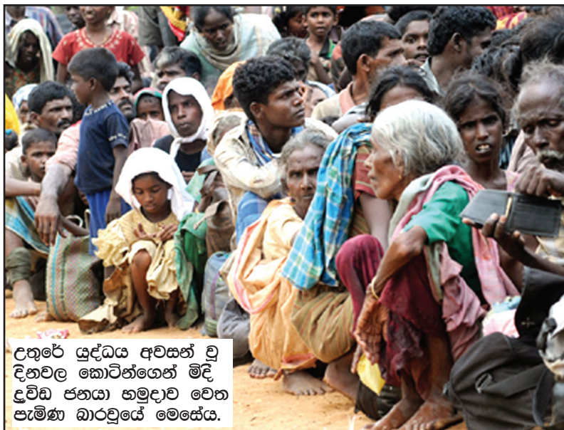
උතුරේ යුද්ධය අවසන් වූ දිනවල කොටිගෙන් මිදී උඩ්ඩ පනයා හමුදාව වෙත පැමිණ බාරවූයේ මෙසේය.