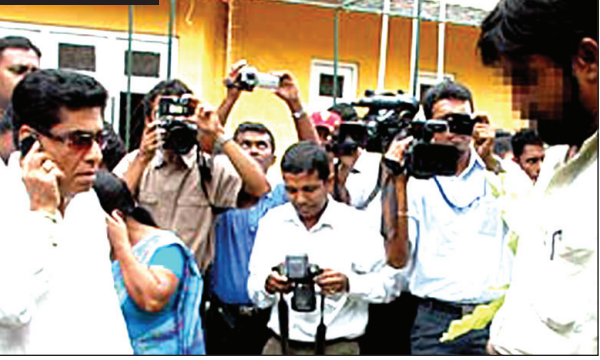
පසුගිය මාසයේ ඇමති මර්ටින් සිල්වා කැළණියේ සමාධි නිලධාරියෙකු කඹයකින් අඹ ගහකට තබා බැන්නේය

පැමිණවීම් සහ ඔවුන් ගස්වල ගැට ගැසීම් මන්ත්‍රීවරුන්ට සුදුසු නොවේ. පාර්ලිමේන්තුවේ වාද විවාද අඩංගු නැත්සාර්ථක වාර්තා කියවන, පරිශීලනය කරන විද්වතෙකු, ගුරුවරයෙකු හෝ ශිෂ්‍යයෙකු හෝ අද සොයාගත නොහැකි ය. එසේ නම් අපේ පාර්ලි මේන්තුවෙන් අර්ථාන්විත කායායක් සිද්ධවන්නේ ද? 2010 ජුනි මස මහා බ්‍රිතාන්‍යයේ ඊලිං ප්‍රදේශයේ (Ealing West) ලේබර් පක්‍ෂයේ මන්ත්‍රීවරයෙකු වන ස්ටීවන් ටිම්