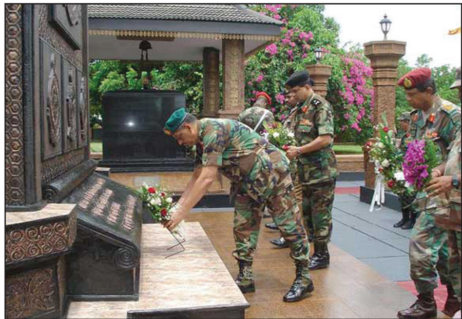
Sri Lanka Army Chief paying his respect to the 'War Heroes' memorial ශ්‍රී ලංකා හමුදාපතිවරයා රණවිරු ස්මාරකයට තම ගෞරවය පුද කරන යුරු

Paying utmost tribute to the sacrifices made by the tri-forces personnel and Police in the call of duty, the Army Chief Lieutenant General Sarath Fonseka unveiled the 'War Heroes' memorial at Palaly, during a field visit made to the peninsula this morning, September 6.