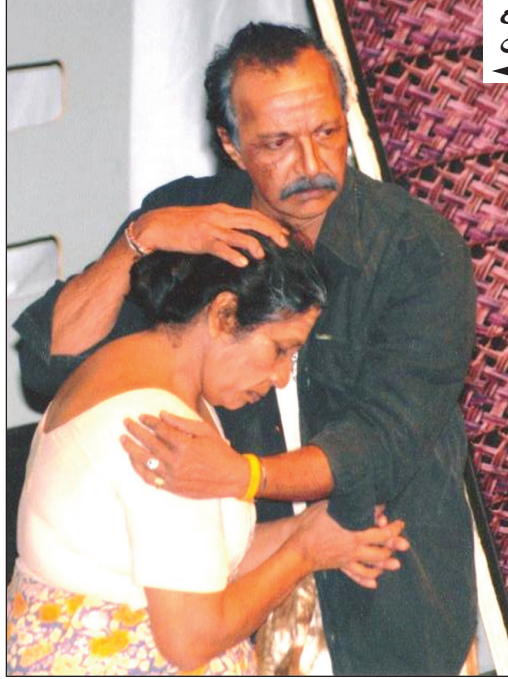
ආර් ආර්ගේ මුල් කැලණි පාලම නාට්‍යයේ රහපෑ නිල් අලස් හා රමණා වනිගසේකර

මම ආර් ආර් හඳුනාගන්නේ 1970 දී ඔහුගේ ගේ කුරුල්ලෝ නම් නව කතාව පිටවූ දිනවලමය කොළඹ යූනියන් පෙදෙසේ සතොස කායාර්යාලයට හිතවතෙකු හමුවීමට ගිය දිනක මගේ මිතුරාගේ මේසයට යාබද මේසයේ ලිපි ගොණු වශයක් පෙරළමින් සිටි ආර් ආර් මගේ මිතුරා විසින් මට හඳුන්වා දෙන ලදී ඔහුගේ ගේ කුරුල්ලෝ නමින් අළුත් නවකතාවක් ඊට කලින් සතියේ නිකුත් වූ බව ද කීවේය. ඒ හඳුනාගැනීම නිසාම මම එම නවකතාව මිලදී ගෙන කියවුවෙමි. සතොසට ගිය ඊළඟ වාරයේ නවකතාව පිළිබඳ මම ඔහුට ප්‍රශංසා කළෙමි. ඒ එදා ඇතිවූ මිතුරුකම අප අතර ඔහුගේ