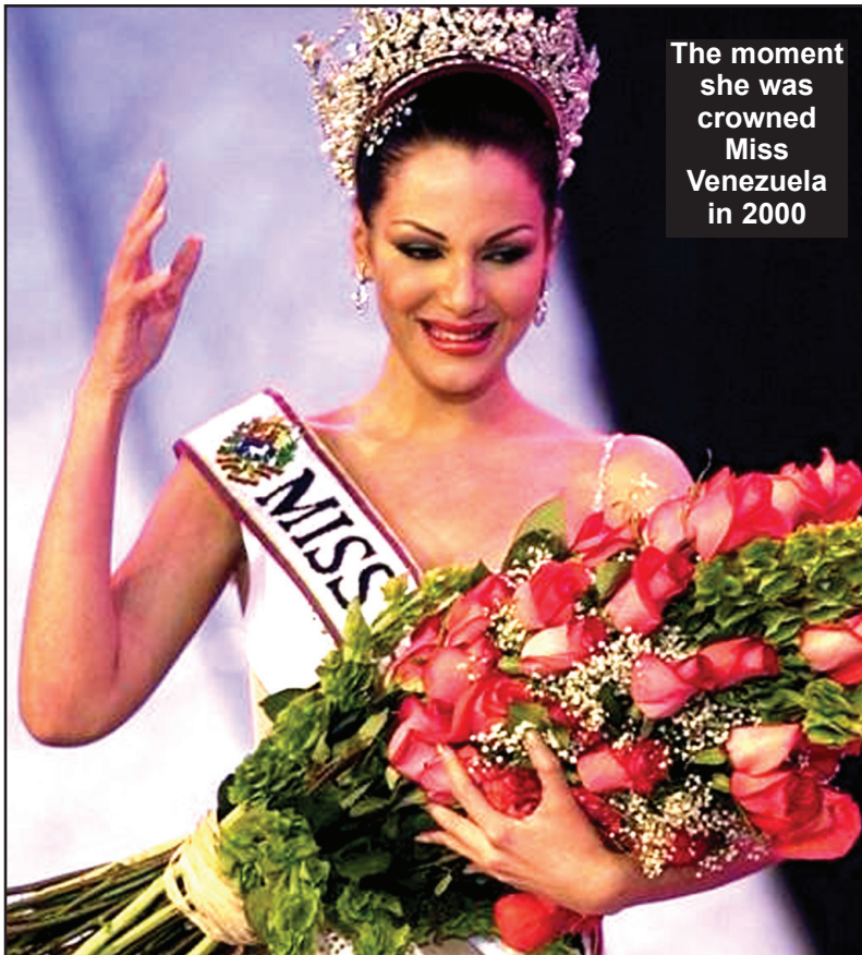
The moment she was crowned Miss Venezuela in 2000

වෙනිසියුලා රූ රැජිණ රිචා එක්වාල් වයස 28 දී පිළිකාවෙන් මියයයි වෙනිසියුලාවෙන් බිහිවූ ප්‍රථම බොද්ධ රූ රැජිණ ඇයයි!