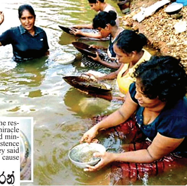
කැළණි ගඟ දියට බැස රතු• ගරන කතුන්

📛 පූගිය මාසයේ හදිසියේම කැළණි ගහේ ඇති වැලිවල රක්තරන් කිබෙන බවට ආරංචියක් පැතිරයත්ම ඒ පළාතේ සහ පිට පෙදෙස්වලින් ද දෙනෝ දාහක් ගැහැණුන්, පිරීමින් සහ ළමුන් තාච්චි, බේසම් සහ වෙනත් භාජන ගෙන දුවගෙන විත් කරවටක් ගහට බැසැ වැලි උඩට ගෙන සෝදමින් රත්තරන් ගරන්නට පටන්